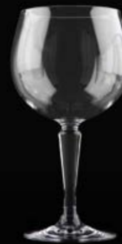
Palma Copa de balón 69 cl

Nos enfocamos en diseñar y vender vasos de policarbonato irrompibles de primera calidad con la misma sensación y aspecto que los vasos reales. Vasos con una calidad mucho mejor de la que probablemente estés acostumbrado. Por favor, solicite una muestra para sentir la diferencia.