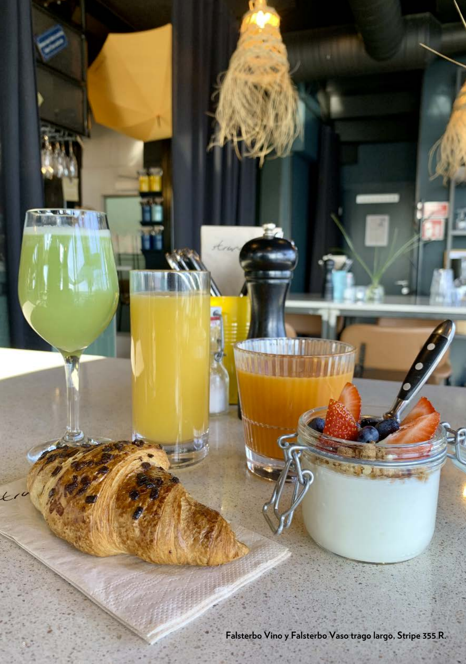
Falsterbo Vino y Falsterbo Vaso trago largo, Stripe 355 R.