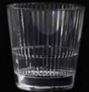
Stripe 355 R 35,5 cl