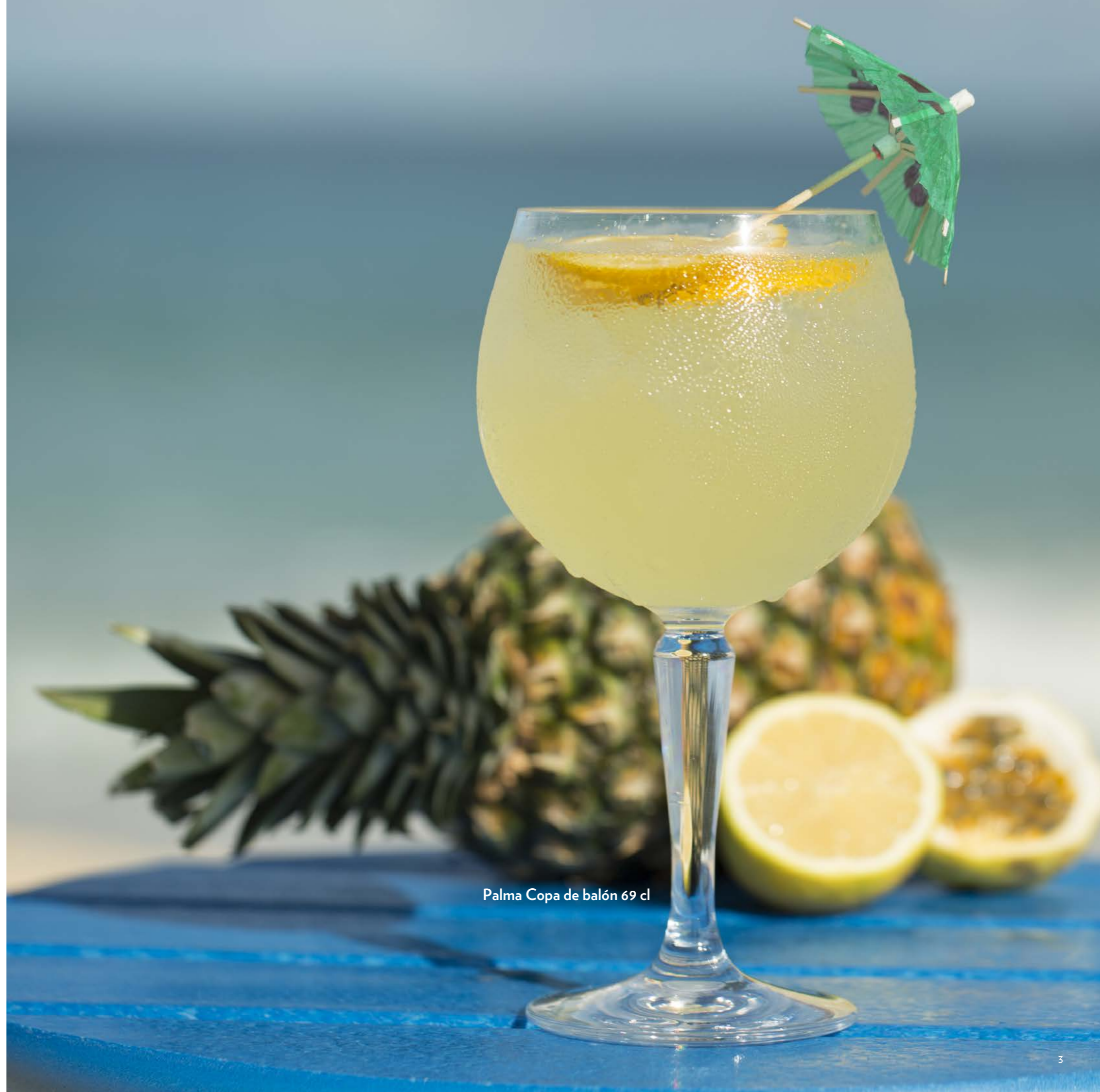
Palma Copa de balón 69 cl

Para ayudarle a ofrecer una experiencia de primera clase que refleje lo que representa su hotel, bar o club nocturno, nuestros vasos de plástico irrompibles de primera calidad son la elección perfecta. Nos aseguramos de que esté a la altura de la calidad que esperan sus huéspedes y clientes.