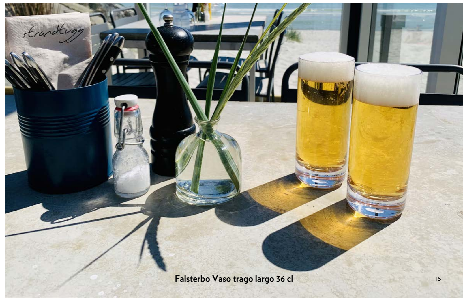
Falsterbo Vaso trago largo 36 cl

No utilice benceno, alcohol, éter ni disolventes orgánicos para limpiar nuestros productos. No deje los vasos donde usó productos grasosos y lácteos como leche, café, o té durante un período más prolongado, ya que podrían dejar un borde. Los productos de policarbonato son increíblemente resistentes, por lo que rayarán otros productos de policarbonato si se les permite frotar entre sí.