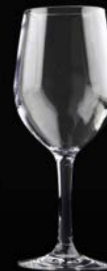
Falsterbo Vino 32 cl

*Probado con 2.000 piezas sin ningún comentario.