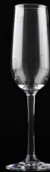
Falsterbo Champán 17 cl