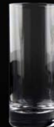
Falsterbo Vaso trago largo 36 cl